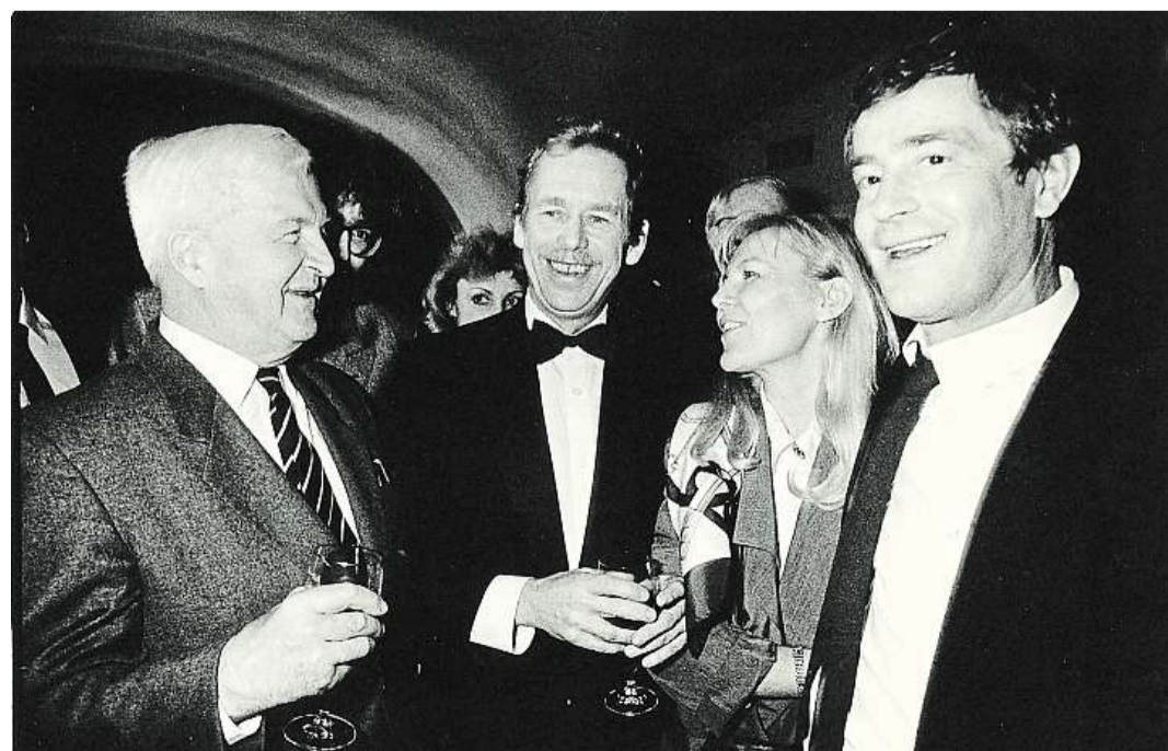
Divadlo Na zábradlí, 90. léta. Zdeněk Urbánek s Václavem Havlem, Karlou Chadimovou a Janem Třískou.

Skenuju to a třídím, odděluji věci, které mají význam politický, společenský, od těch, které mají význam hlavně pro mě. Chci všechno protřídít a darovat Památníku národního písemnictví, aby to badatelé měli k dispozici, myslím, že stát má za takové archiváře převzít odpovědnost a instituce jako památník písemnictví je zásadně lépe podporovat.